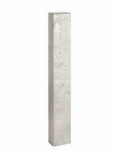
18,5 x 12,5 x 120 cm