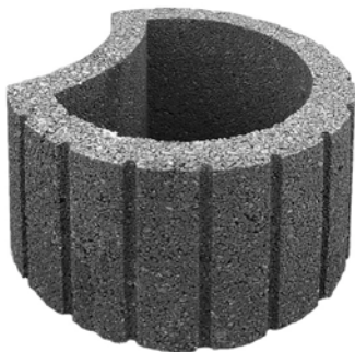
Ø 48 x 30 cm