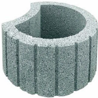
Ø 48 x 30 cm